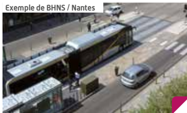
Exemple de BHNS / Nantes